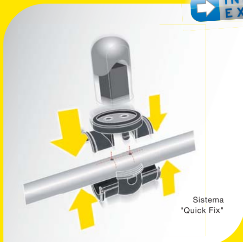
Sistema "Quick Fix"