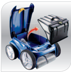
Filtro higiénico fácil de limpiar