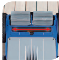
Boquilla de aspiración extra ancha para aspirar todo tipo de residuos