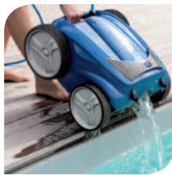
Empuñadura ergonómica para una óptima manipulación