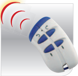
Mando a distancia