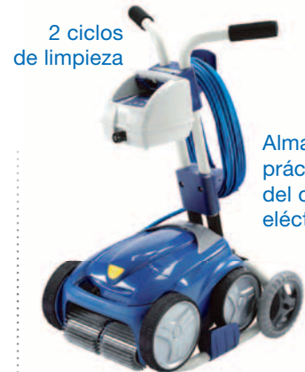
2 ciclos de limpieza