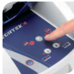
Tiempo de limpieza ajustable (-30 min /+1h)