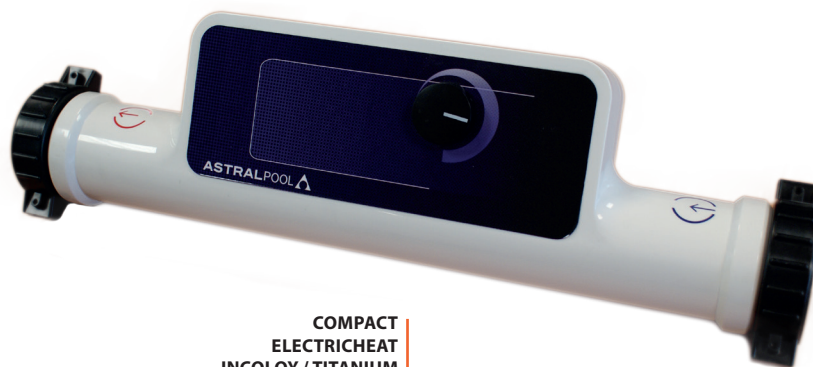
COMPACT ELECTRICHEAT INCOLOY / TITANIUM