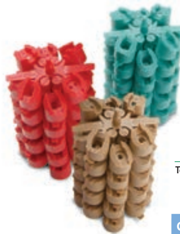
Toberas MPR Serie 5000